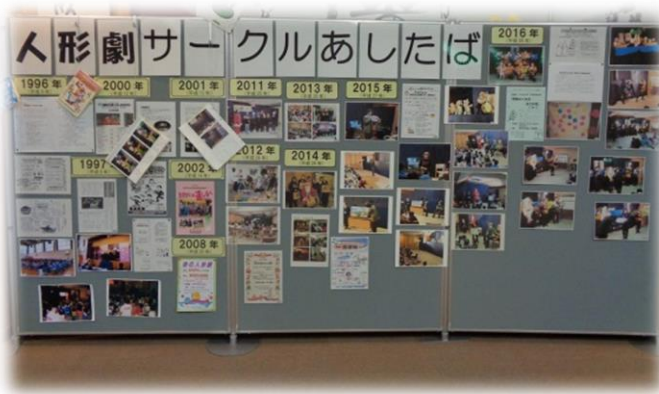
27年間のあしたばの活動を展示

通常イベントの際には図書館スタッフが人形劇の前座をやるのですが、今回はイベント時間を短縮したかったのでサークルの歩み展示に替え、1996年からの27年間の歴史を写真やチラシを集め年代順に掲示。町内だけでなく、下田演劇祭や静岡県人形劇フェスティバル、神奈川県人形劇フェスティバル、広島県で開催された全国大会にまでと活動の輪が広がって、東伊豆町の観光PRまでしたり、あっ晴れ！！な笑顔あふれる活動が満載です。