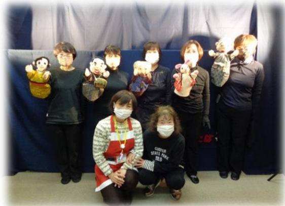
人形劇後のカーテンコール

平和だからこそ「アタリマエ」に図書館サービスや人形劇を開催できると有り難く思います。