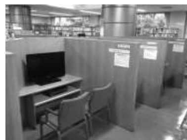
館内視聴コーナーで見ることができます