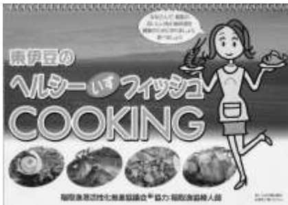
東伊豆のヘルシーいずフィッシュ COOKING 稲取漁港活性化推進協議会 協力：稲取漁協婦人部

実は、郷土の偉人が推し進めた各種の集会行事のような催しが図書館で出来ないかと考えていました。また「正直勤勉賞」を真似た訳ではありませんが、東伊豆町立図書館では毎週土曜日の「おはなし会」に多数回参加した子どもを表彰したり、スタンプラリー「ねえ読んでカード」「読書カード」100冊目ごとに表彰を行って勉学奨励？読書推進につなげています。しかし、けっして冊数を増やすために、雑草や砂、石などを混ぜないで、自分の成長に役立つ本を選び、向上心を大切に人生を切り拓いてほしいと願っています。