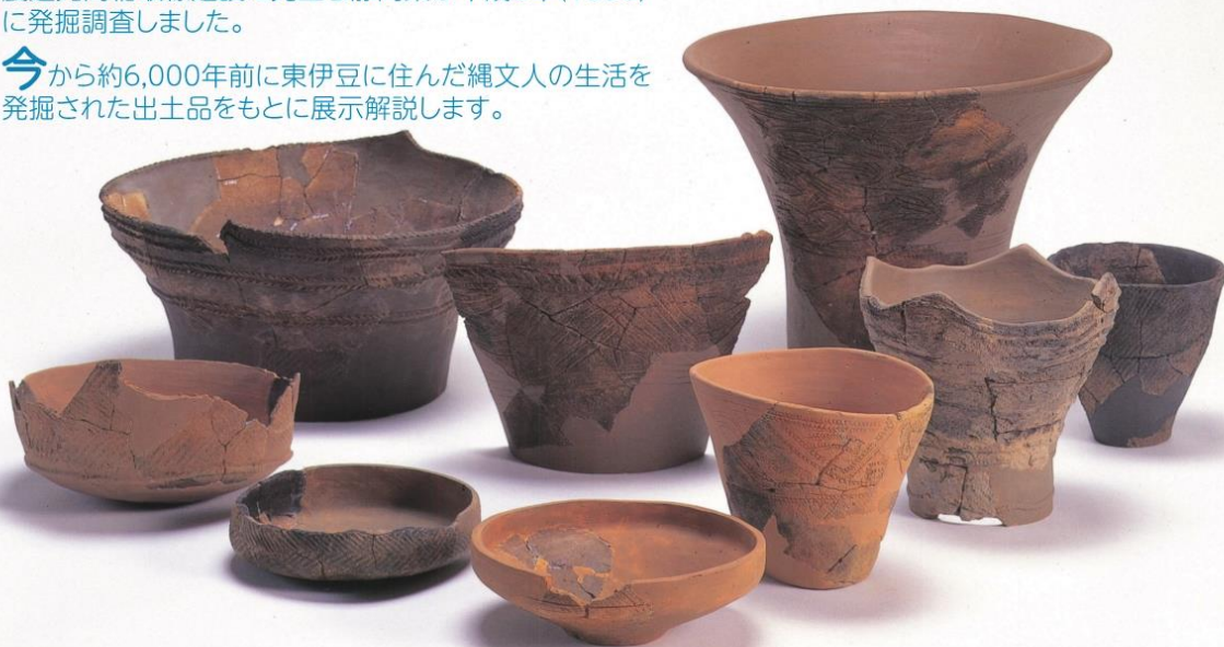
中峯遺跡出土縄文土器

今 から約6,000年前に東伊豆に住んだ縄文人の生活を発掘された出土品をもとに展示解説します。